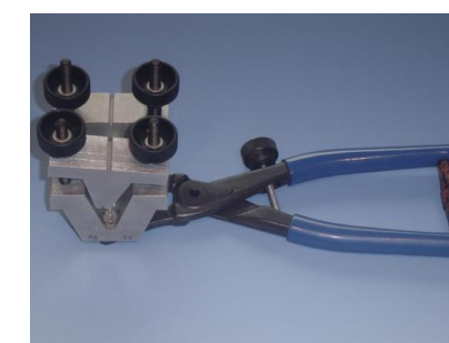
Zaciski prowadzące FZ02