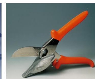
Nożyce kątowe 90°/45°

Oferujemy doradztwo w doborze optymalnego profilu dla potrzeb klienta oraz oferujemy wsparcie techniczne poparte wielodekadowym doświadczeniem w wymiarowaniu systemów napędu i transportu.